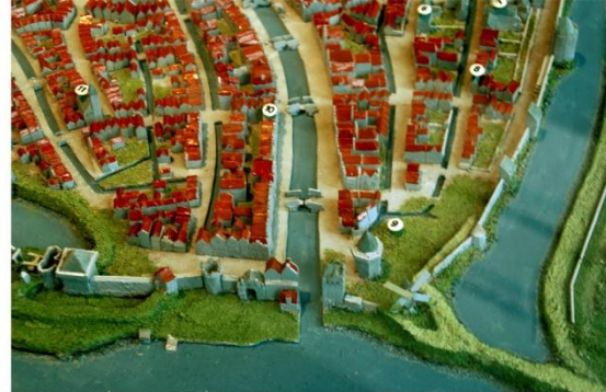
Maquette Gouda (naar Hogenberg, 1585) Museumgouda

In 1361 grensde het water van de watermolen ook aan de dijk, maar dat stuk dijk werd tien jaar later weg gegraven en in plaats daarvan kwam er een stevige houten schutting te staan met een gracht ervoor, om te voorkomen dat mensen de dijk opklommen. 71 De westelijke dijk naar de IJssel en de dijk langs de IJssel sloot het terrein af met nog een poort bij de Spieringstraat. In 1362 werd die dijk bij de IJsseltoren getrokken en alleen die werd aangeduid als 'mijns heren dijk' bij de grote toren. 72 Vlakbij de IJsseltoren lag een valbrug en later, bij de nieuwbouw van de tweede toren daarnaast ten westen, kwam nog een tweede valbrug te liggen.