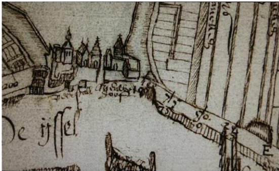
Veerstal, het Nieuwe Hoofd en de Haventoren (1613) kaart van Hendrik Vos

Er werden een houten trapboom, een wenteltrap, en een houten omloop op de toren gemaakt plus nog drie grote zitvensterbanken in de kamer. 19 Boven het woongedeelte lag een zolder, die onder andere diende als graanzolder. 20