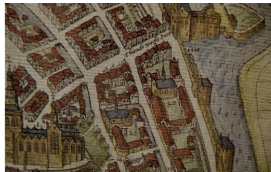
Catharinaklooster (20) afgebeeld op de kaart van Braun en Hogenberg (1585)