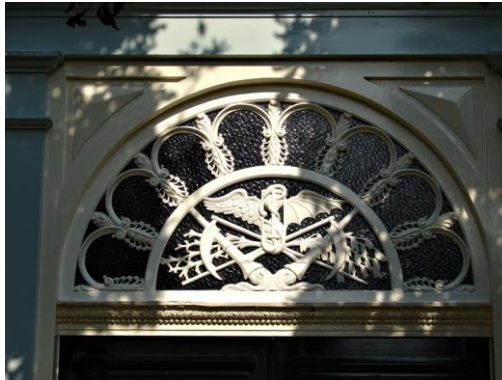
Ingang aula.

bomen aan. 1 Met de aanleg van de ringdijk besteedde de gemeente ook de ophoging van de begraafplaats uit, waarvan de kom binnendijks 166 meter lang, 44 meter breed en 1.96 meter diep was. De eerste ophogingslaag van 94 cm bestond alleen uit rivier- of duinzand en de tweedelaag uit aardspecie samengesteld uit twee delen zand en één deel afval van de steenplaatsen.. 2 Jan Broere was de laagste inschrijver met een bedrag van 14.000 gulden en kreeg het werk. Tijdens de grondwerkzaamheden in 1829 besteedde de stad Gouda eveneens de bouw aan van het huis bij de entree van de nieuwe begraafplaats.