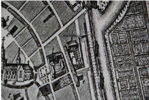
Grondtekening Gouda in 1744 van het Tuchthuis

De regenten, meestal oud-schepenen mochten straffen opleggen, die soms redelijk ver gingen. Dit waren onder andere geseling, het vastkluisteren van de gestrafte aan ijzers en kettingen, vasten op water en brood en eenzame opsluiting.