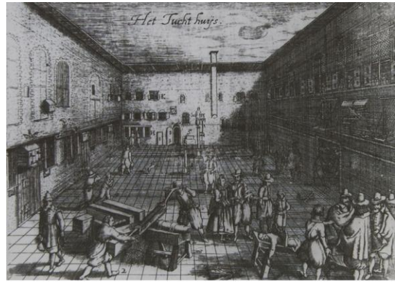
Binnenplaats van het rasphuis in Amsterdam, 1612, gravure

werd ingewaterd voor de keuken en voor andere voorzieningen. Onder de regentenkamer bevond zich nog een ruimte voor een 'gevangenhok' met daar weer onder een watergat met de bijnaam de 'donkere hel'. De bodem van de 'hel' bestond uit een houten vloer op eikenhouten balken vlak boven het water en diende voor de eenzame opsluiting. Lieven Abrahams werd tot een verblijf in de 'hel' veroordeeld in 1641. 14 Aan de eenzame opsluiting was een maximum tijd van vier weken verbonden. In 1818 werd deze cel naar aanleiding van een reparatie namelijk beschreven. De cel was 1.95 m in het vierkant met een ijzeren kram in de muur en een hardstenen zitting. 15