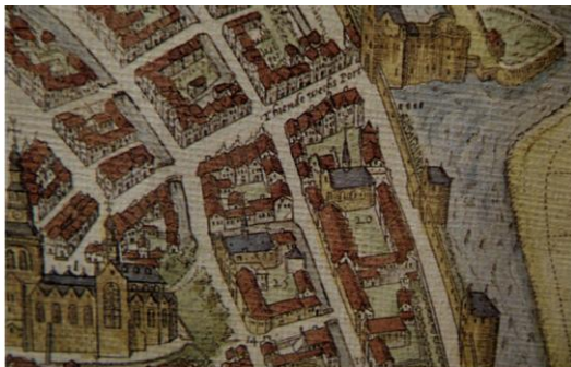
Catharinaklooster (20) afgebeeld op de kaart van Braun en Hogenberg (1585)

men vond het al voldoende om alleen de ramen te dichten in afwachting van een definitief besluit. Buitendien zaten drie huurders in het paterhuis en die moesten zo snel mogelijk naar een ander huis uitzien.